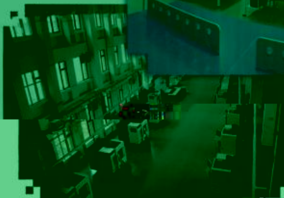
DMG 数控技术 训练场所